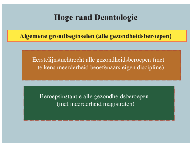
Fig. 3: Een situatie waar er geen Ordes meer bestaan maar waar (naar Nederlands model) er een tuchtrecht wordt georganiseerd voor alle gezondheidsberoepen onder de koepel van een Hoge Raad voor Deontologie.

In welke richting het tuchtrecht zal evolueren is onduidelijk. De vele wettelijke initiatieven die spaak liepen, tonen aan dat de Orde van geneesheren (OVG) een harde noot om kraken is. Als men, beginnend van een blanco blad, een toezichthoudend orgaan voor alle gezondheidsberoepen zou moeten ontwerpen, zou men – zoals in Nederland of in Finland – kunnen opteren voor een publieke autoriteit voor medische regulering. Hoe zo’n structuur er kan uitzien wordt uitgebeeld in figuur 3. Eén van de opwerpen kan het kostenplaatje zijn. Men moet zich dan wel de vraag stellen of een goede medische regulering zoveel geld moet kosten. Dat leren we ook uit de medische regulering in Nederland. Dat geld wordt echter terugverdiend omdat een ethische en wetenschappelijke uitoefening van de medische beroepen essentieel is om nodeloze uitgaven en ontsparingen